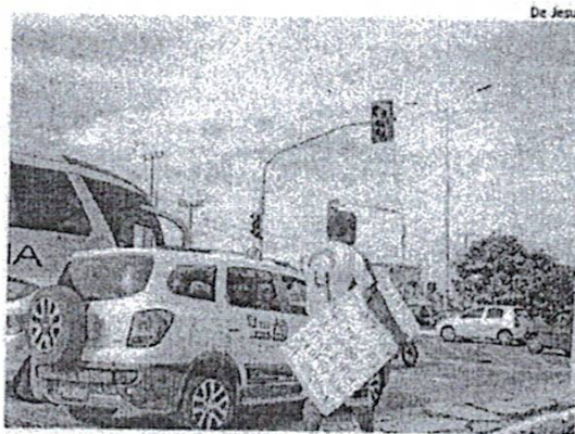
Venezuelano pede esmolas ao longo da Av. Jerônimo de Albuquerque

Na capital maranhense, a concentração de venezuelanos pelas ruas e avenidas, seja pedindo esmola ou comida especialmente em cruzamentos semafóricos, foi maior a partir do