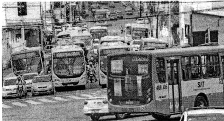
Com greve planejada para iniciar na próxima terça-feira, rodoviários querem regularização salarial e volta de benefícios em algumas empresas

Sindicato já está notificando órgãos e empresas sobre a greve; após 72 horas da conclusão desta etapa, trabalhadores devem suspender atividades