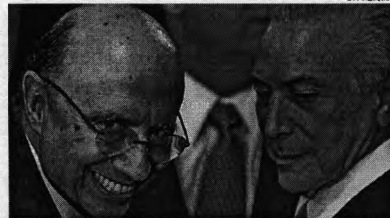
Henrique Meirelles vai se assumir como candidato de Michel Temer

Em meio à perspectiva de que a projeção do Produto Interno Bruto (PIB) para este ano possa ser rebatizada por causa da greve dos caminhoneiros e do cenário eleitoral incerto, Meirelles admitiu que a melhora dos indicadores econômicos não se refletiu na economia. "Uma recessão brutal como essa, produto de vários anos, não se conserta do dia para a noite, mas o fato é que estamos na direção certa", disse.