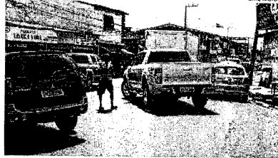
Pessoas e veículos competem por espaço em via da Vila Palmeira

Na Rua Princesa, a situação é semelhante, e além disso, há pontos irregulares onde há os feirantes, que amarram suas bancas na rua. De um lado, os feirantes e do outro a fila de veículos estacionados, quase não sobrando espaço para os pedestres, que circulam freneticos pelo local.