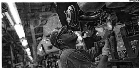
Produto Interno Bruto Brasileiro (PIB), que é a soma de todos os bens e serviços, será menor este ano

aproximam da estimativa do mercado financeiro, anunciada no início da semana, que também ajustou expectativas para o crescimento do PIB e variação da inflação.