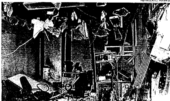
Uma das agências bancárias que ficaram destruídas por quadrilheiros ontem, na cidade de Aldeias Altas

Equipes das polícias Civil e Militar estão à procura dos criminosos que aterrorizaram o município de Aldeias Altas, a 392 km de São Luís, na madrugada de ontem. Cerca de 15 bandidos ainda não identificados exploraram, na cidade, agências do Banco Brasil, do Bradesco, dos Correios, casa lotérica e um supermercado, de acordo com informações da polícia.