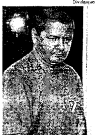
Júnior de Nenzim não deverá participar da reconstituição

A reconstituição do crime que culminou na morte do ex-prefeito de Barra do Corda Manoel Mariano de Sousa, o Nenzim, está prevista para ser realizada amanhã, dia 2, a partir das 6h. De acordo com a Polícia Civil, a reconstituição do fato tentará checar, de forma prática, todas as versões apuradas durante as investigações.