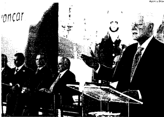
Ministro Moreira Franco destacou a importância do programa do Governo Federal, que foi lançado ontem

3 mil municípios Em todo o país, são diversas obras presentes em mais de 3 mil municípios brasileiros, que incluem desde a construção de creches e unidades básicas de saúde até a finalização de hidrovias. Todas as regiões do Brasil serão