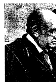
Gilmar Mendes e Roberto Barroso bateram boca durante sessão

Durante uma sessão de debates, ficou entendido também que a competência para homologar os acordos cabe somente ao relator do caso, e não ao colegiado do STF seja plenário ou uma das turmas.