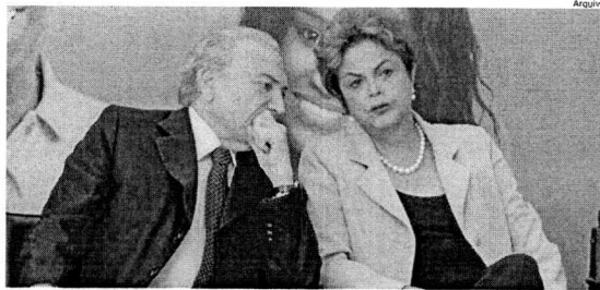
Michel Temer e Dilma Rousseff começam a ser julgados hoje no TSE, por ações nas eleições de 2014

Na última semana, o ministro Gilmar Mendes afirmou não ser possível prever a duração do julgamento da chapa. "Não sabemos quantas incidentes vamos ter."