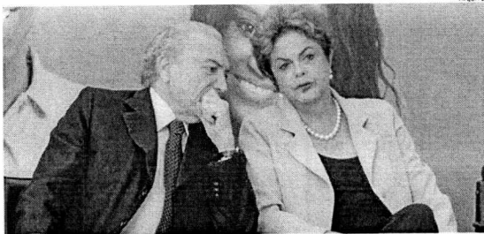
Michel Temer e Dilma Rousseff começam a ser julgados hoje no TSE, por ações nas eleições de 2014