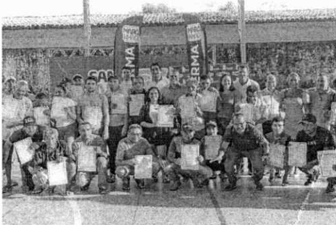
vimento das comunidades locais.

A entrega dos títulos de propriedade representa, não apenas um marco legal, mas, também, um passo crucial para garantir segurança e estabilidade às famílias rurais, possibilitando o acesso a políticas públicas e o desenvol-